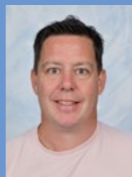
D. de Crom B1P Lichamelijke opvoed.