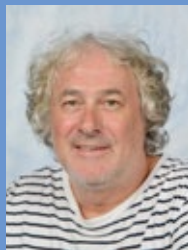
H. Elst B1C Nederlands/muziek