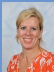
S. Bekema B1J Wiskunde