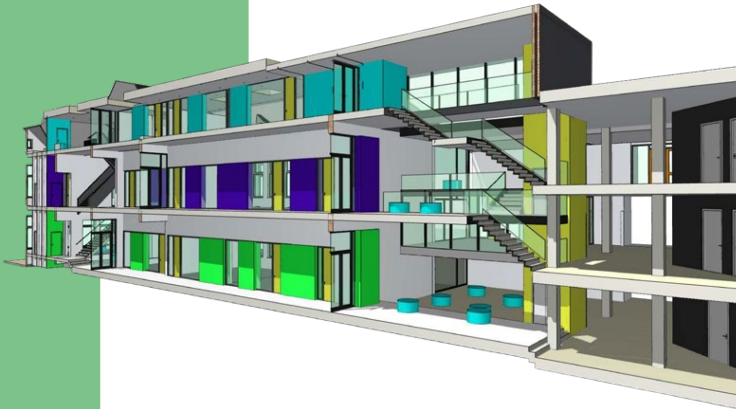
Dwarsdoorsnede van het brugklasgebouw.