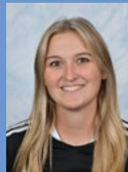
V. Overbeeke B1E Lichamelijke opvoed.