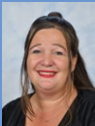
S. van Schilt B1B Wiskunde