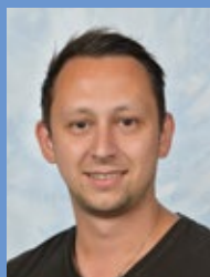
A. Ligthart B1G Geschiedenis