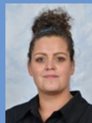
A. Bakx B1R Nederlands